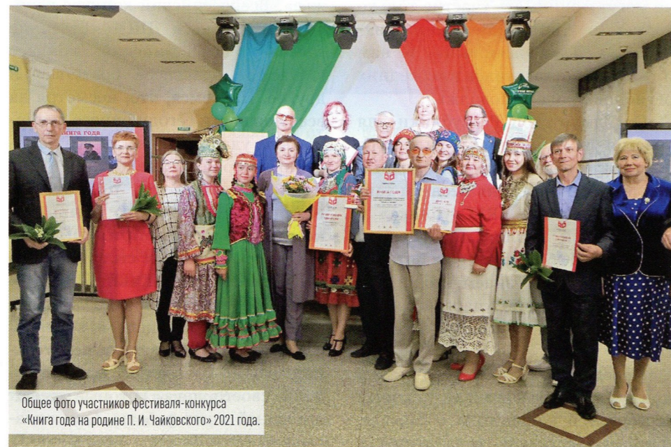
Общее фото участников фестиваля-конкурса «Книга года на родине П. И. Чайковского» 2021 года.

Также в двух конкурсах участвовали книги Мусы Джалиля